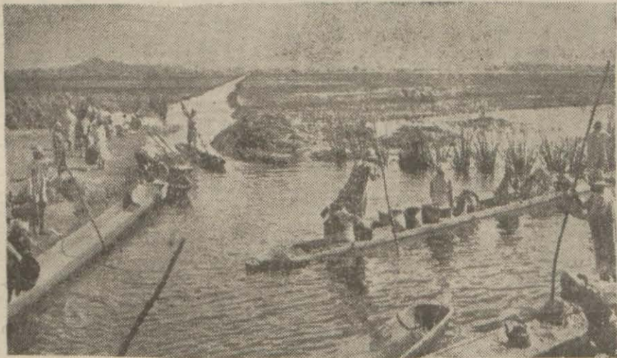
Madagaskar adasında piring nakledilirken

Harbin dönüm noktasını teşkil edecek olan bu ilkbahar taarruzu esnasında, her iki tarafın da zehirli gaz kullanacakları ihtimal dahilinde görülmektedir. Diğer taraftan son zamanlarda (Devamı 5 inci sayfada)